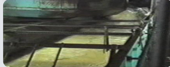
RIESGO AHOGAMIENTO / SEPULTURA