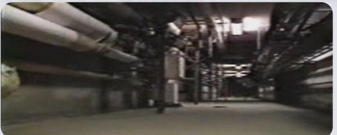
RIESGO DE SEGURIDAD Y SALUD